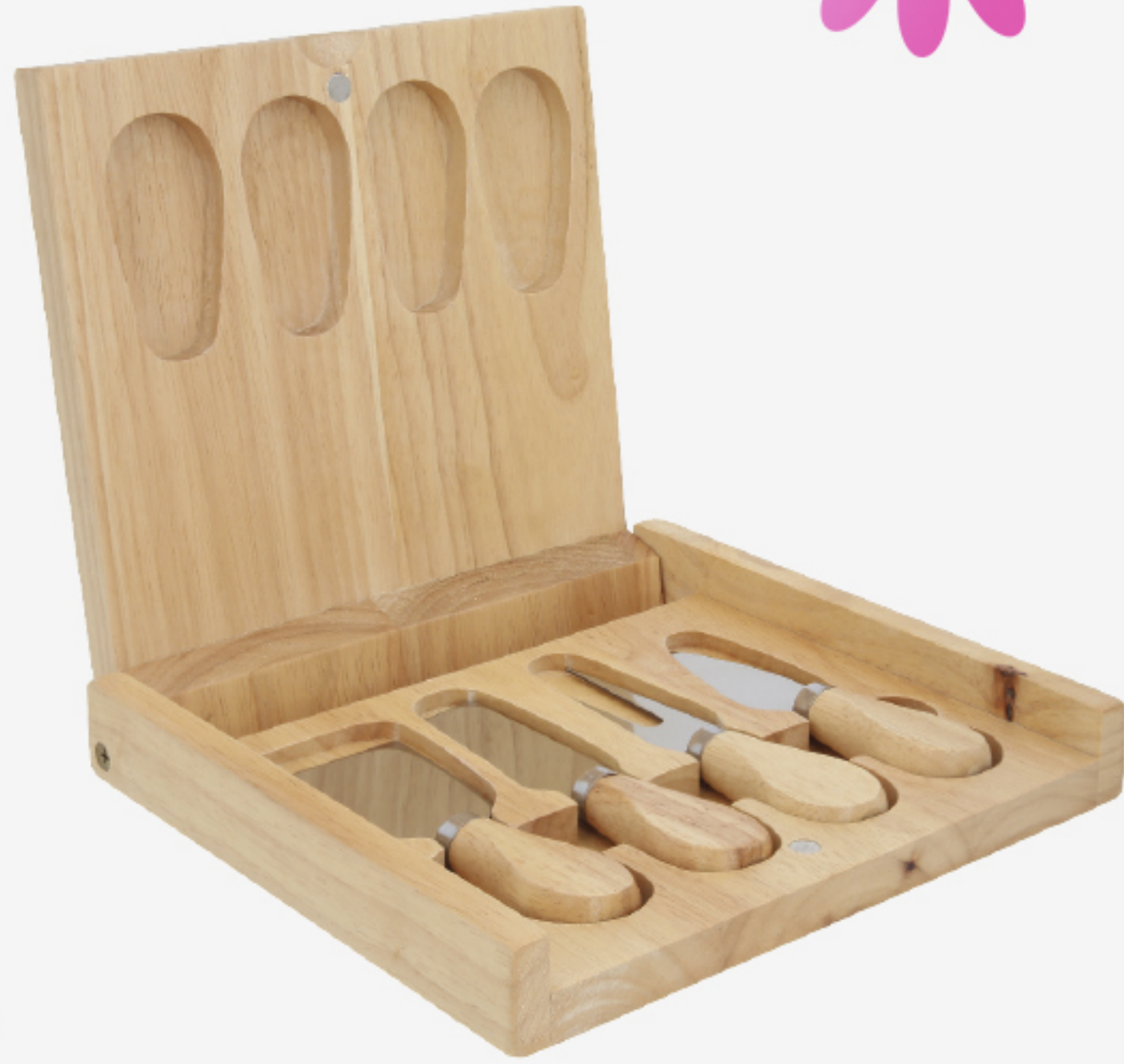
Tabla de quesos con estuche de madera. Incluye 4 piezas: 1 mini cuchillo de pala, 1 mini tenedor, un cuchillo de avión estrecho y un cuchillo.